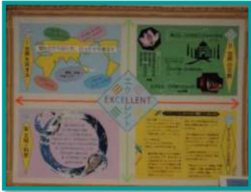
エクセレント講座

限られたスペースの中で、講座/WSの内容をより良く理解してもらえよう、講師を紹介したり、学習の成果をまとめたり色々工夫をしてポスターを作成しています。