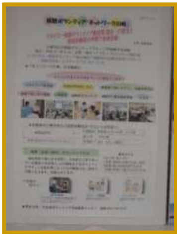
ネットワーク川崎 (傾ボラ受講生 OB)