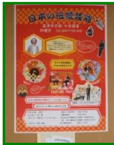
日本の伝統芸能講座