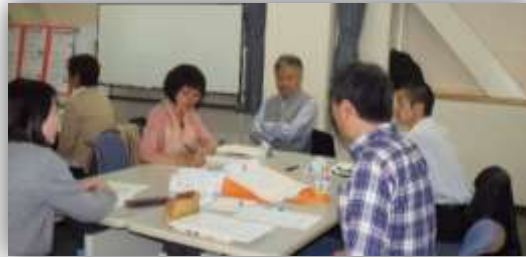
政治・社会/熟議 (杉田敦先生も！)