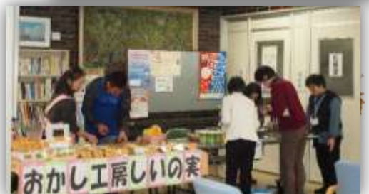
おかし工房しいの実