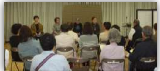
フロンティア/朗読