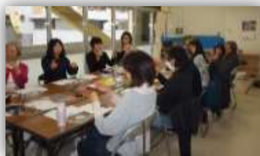
タティングレース