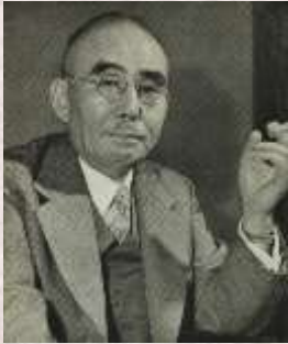
国立国会図書館ウェブサイト

石橋湛山の言論と活動を時代の背景とともに解説し、歴史的意味と現代的意義の双方から考察します。