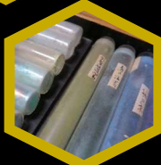
●画室 および 清方遺愛品